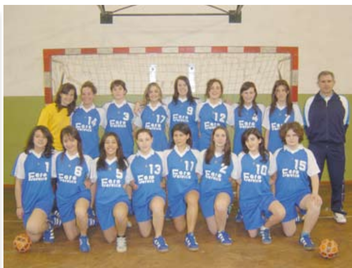
Vi presentiamo le due squadre under 15 maschile e under 14 femminile che hanno vinto il campionato nazionale di pallamano a Misano Adriatico.