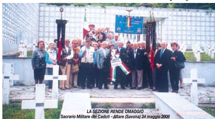
LA SEZIONE RENDE OMAGGIO Sacralo Militare dei Caduti - Altare (Savona) 24 maggio 2006