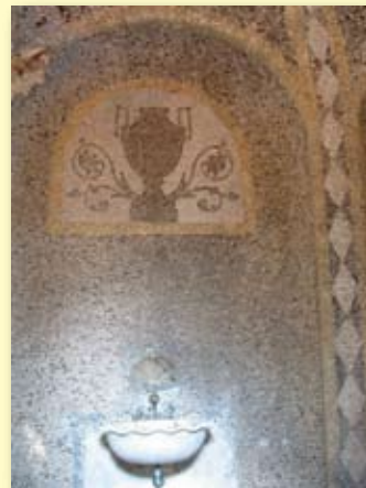
Il ninfeo di Villa Buttafava ►

Dietro al ninfeo si cela un grosso arco che sta a testimoniare la veridicità di vari racconti sull'esistenza di un passaggio segreto che collegava le cantine al ninfeo; il passaggio è stato probabilmente chiuso verso la metà del '900 riempiendolo di terra e detriti.