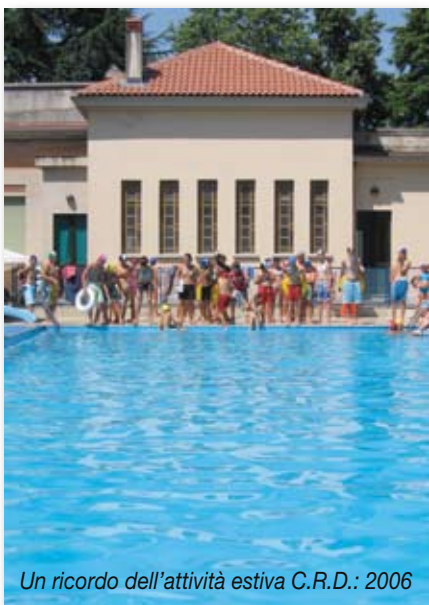
Un ricordo dell'attività estiva C.R.D.: 2006

http://www.innovazione.gov.it/ita/normativa/pubblicazioni/inn_dig_famiglie.shtml