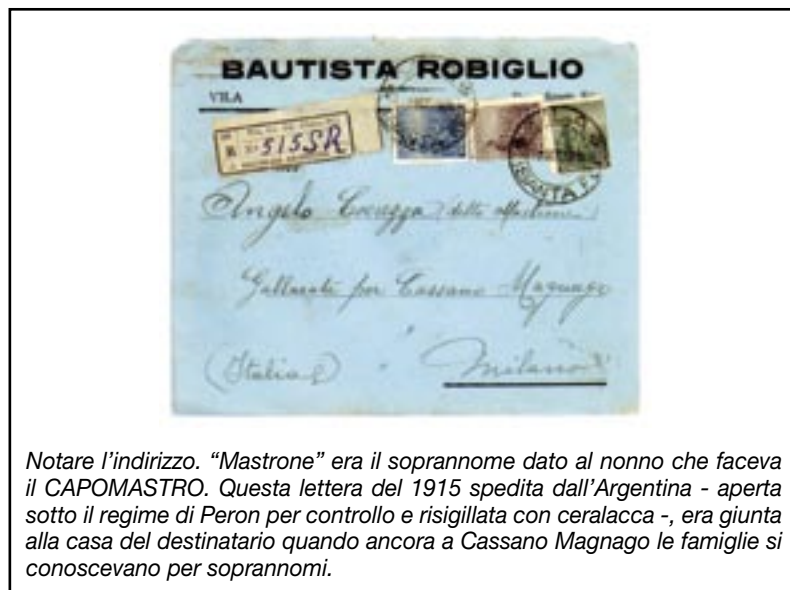
Notare l'indirizzo. "Mastrone" era il soprannome dato al nonno che faceva il CAPOMASTRO. Questa lettera del 1915 spedita dall'Argentina - aperta sotto il regime di Peron per controllo e risigillata con ceralacca -, era giunta alla casa del destinatario quando ancora a Cassano Magnago le famiglie si conoscevano per soprannomi.