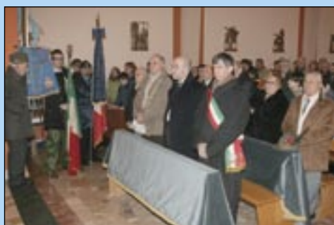
29.01.06 - Memory day

Si connota come una strada in salita. Infatti porta alla collina di Soiano. Prima era chiamata " Contra-da della salute ", perchè portava in "alto" a respirare aria buona.