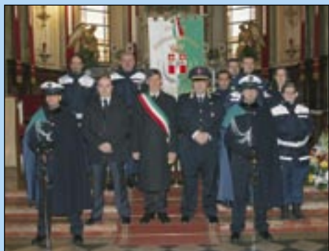
22.01.06 - Festa della Polizia Locale