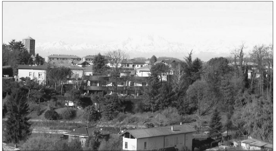
Foto panoramica con vista, sullo sfondo, del Monte Rosa

Per questo motivo ritengo che non sia importante quali strutture deve gestire l'amministrazione comunale, ma quali strutture esisto-