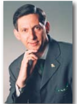
Il Sindaco Aldo Morniroli

superiore, che vogliamo affrontare in modo serio e costruttivo, ma è anche importante non dimenticare gli edifici esistenti, quelli che quotidianamente vengono occupati dai nostri ragazzi. La sicurezza è sicuramente un argomento molto sentito da Voi cittadini. Purtroppo spesso dobbiamo fare i conti con il numero esiguo di agenti. Il nostro impegno è quello di incrementarli e di utilizzare nuovi sistemi di rilevamento per dare delle risposte concrete. Lo sviluppo del centro storico, del recupero degli edifici storici della nostra città potranno contribuire a dare a Cassano Magnago un aspetto diverso. Sicuramente tutto questo dovrà interagire con eventi culturali, sportivi e ludici. Eventi che negli ultimi cinque anni hanno contribuito a far vivere la città e che dovranno trovare un naturale sviluppo in questi anni. Chiudo questo editoriale con il tema della famiglia. Troppo spesso si dice che il mondo è cambiato, ma troppo spesso non si fa niente per migliorarlo. Le famiglie sono sempre state un punto di riferimento per tutto. Oggi purtroppo questo ruolo si è perso e se ne vedono gli aspetti negativi. Tutti insieme dobbiamo fare in modo che il ruolo della famiglia ritorni ad essere un ruolo primario. Nel programma ci sono le basi e da oggi si parte per realizzarle. Con questo augurio di speranza colgo l'occasione per porgere a tutti Voi e ai Vostri familiari i migliori auguri di Buon Natale ed un felice, ma soprattutto sereno, 2008.