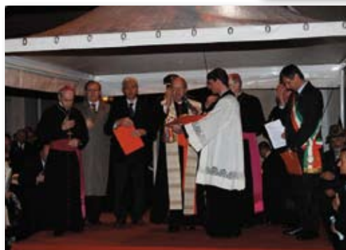
Visita del Cardinale Stanislaw Dziwisz per benedizione e inaugurazione Monumento al S. Padre - San Giulio - 26.10.2007

Via al Corbè MOZZATE (Co) Tel. 0331.833164